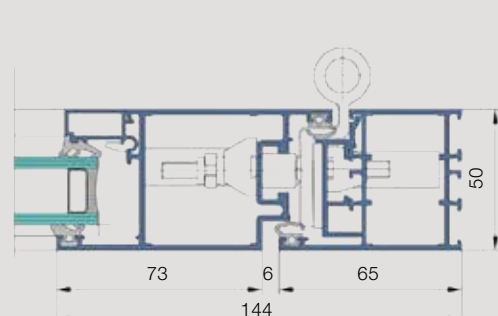
Tür US-2: Horizontalschnitt mit Rollenbändern