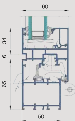
Fenster US-2: Vertikalschnitt